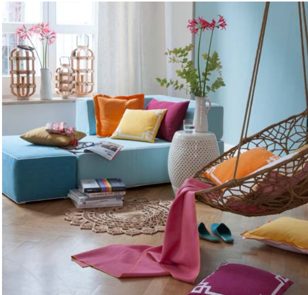
Die Farben beim Trendthema Florida sind besonders intensiv. Höpke

Die Förderung des Raumausstatter-Nachwuchses liegt dem Deco Team ebenfalls am Herzen. Daher gibt es am Messerfreitag ein spezielles Programm für die angehenden Gesellen und Meister. ■