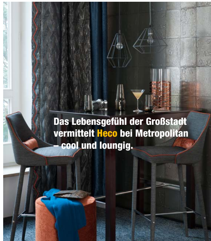
Das Lebensgefühl der Großstadt vermittelt Heco bei Metropolitan – cool und loungig.