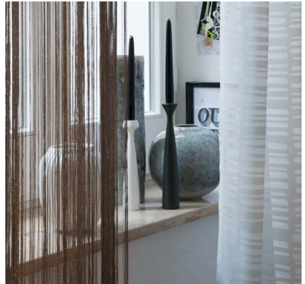
Der Name ist Programm: Bei Glamour setzt Porschen farblich auf Gold und Glanz.