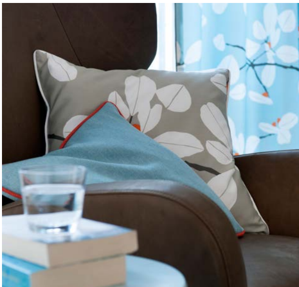
Mit Grey und Bleu auf natürlichen Materialien inszeniert Gardisette das Trendthema Nordic.